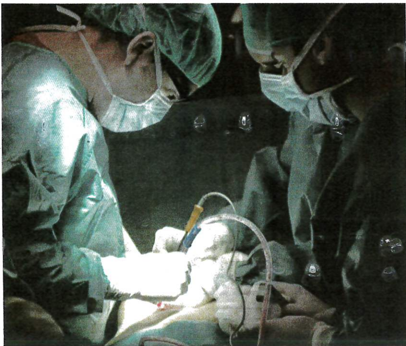
JANGAN takut mengambil langkah pertama untuk menjadi seorang penderma. - GAMBAR HIASAN

doktor turut membetulkan semula keadaan itu menjadikan tempoh pembedahan memakan masa sehingga lima jam. Kalau tidak kerana